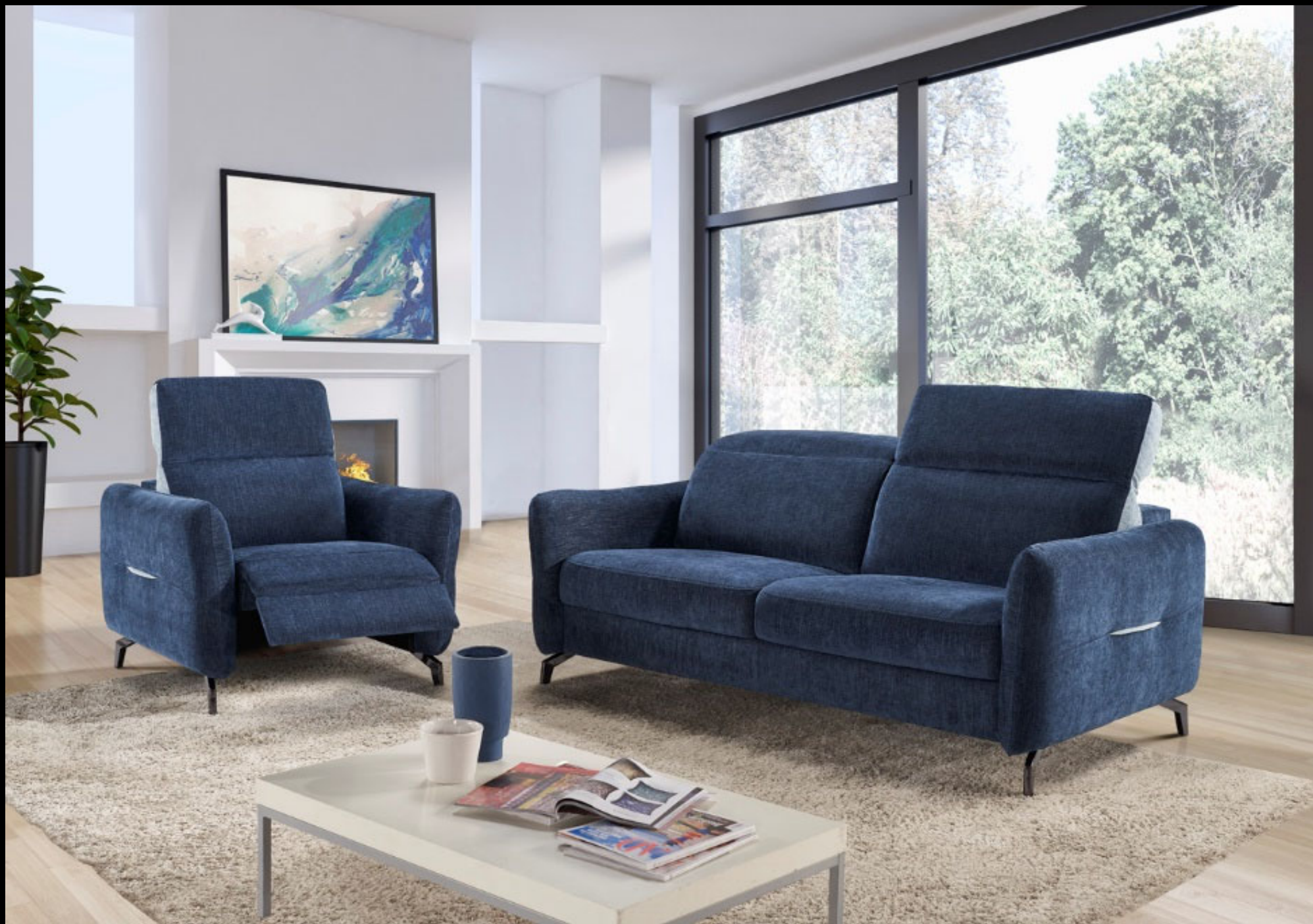
Meccano 3 places + Fauteuil – Accoudoir C Dossier B Pied A