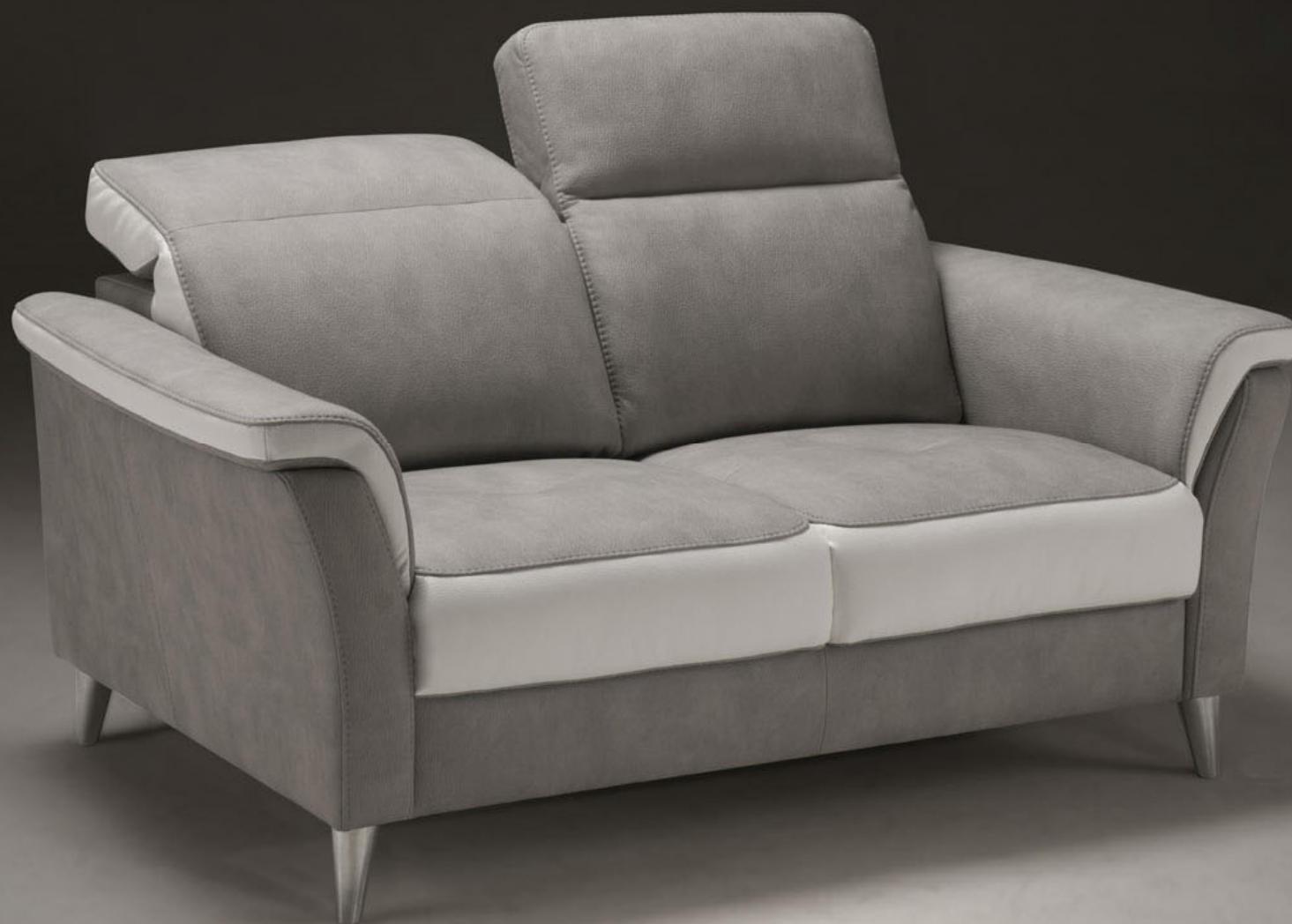
Meccano 2 places – Accoudoir B Dossier B Pied B