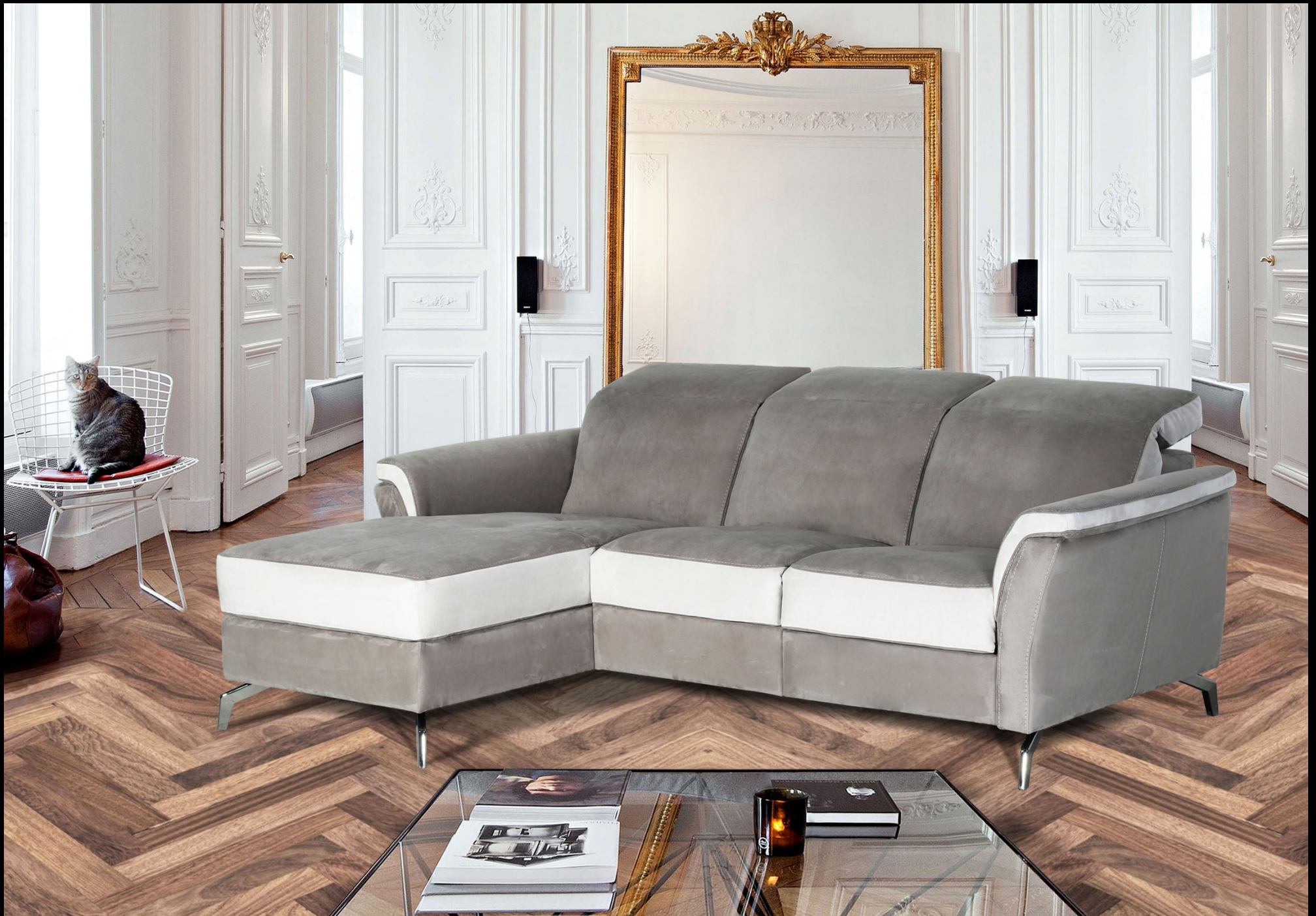
Meccano 2 places chaiselongue – Accoudoir B Dossier B Pied A