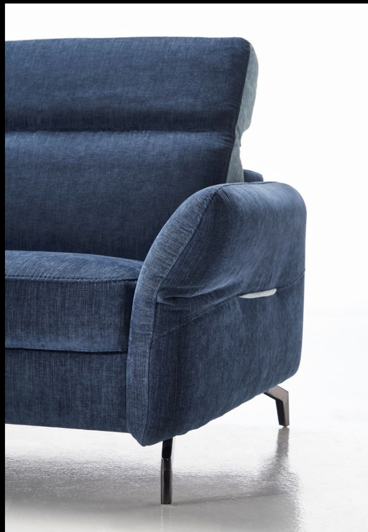
Meccano – Détail de finition