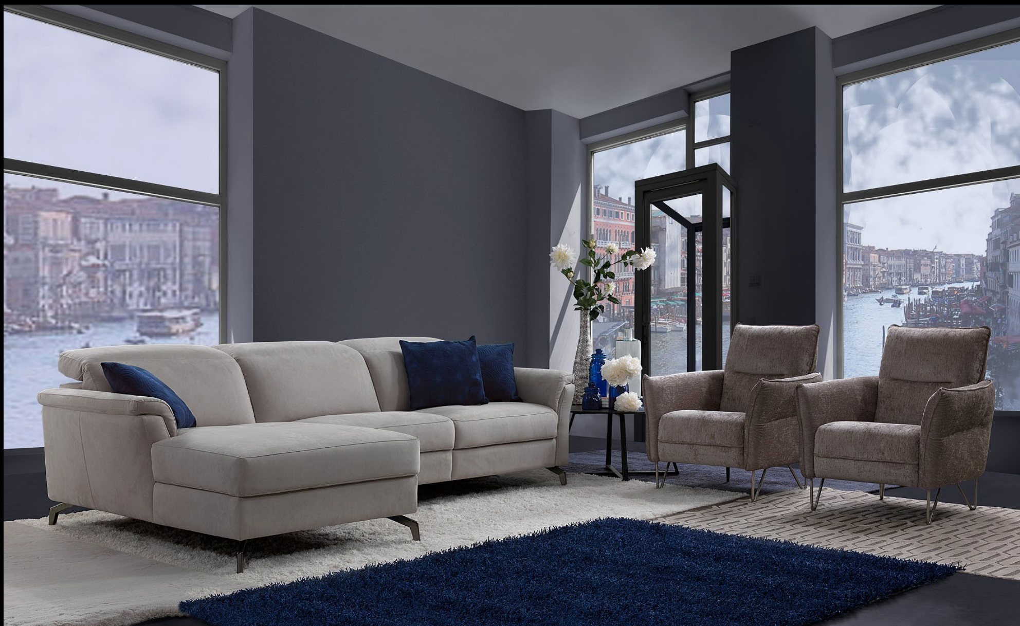
Meccano 3 places Chaiselongue – Tissu et Détail identique Accoudoir B Dossier B Pied A Petit Fauteuil Shirley