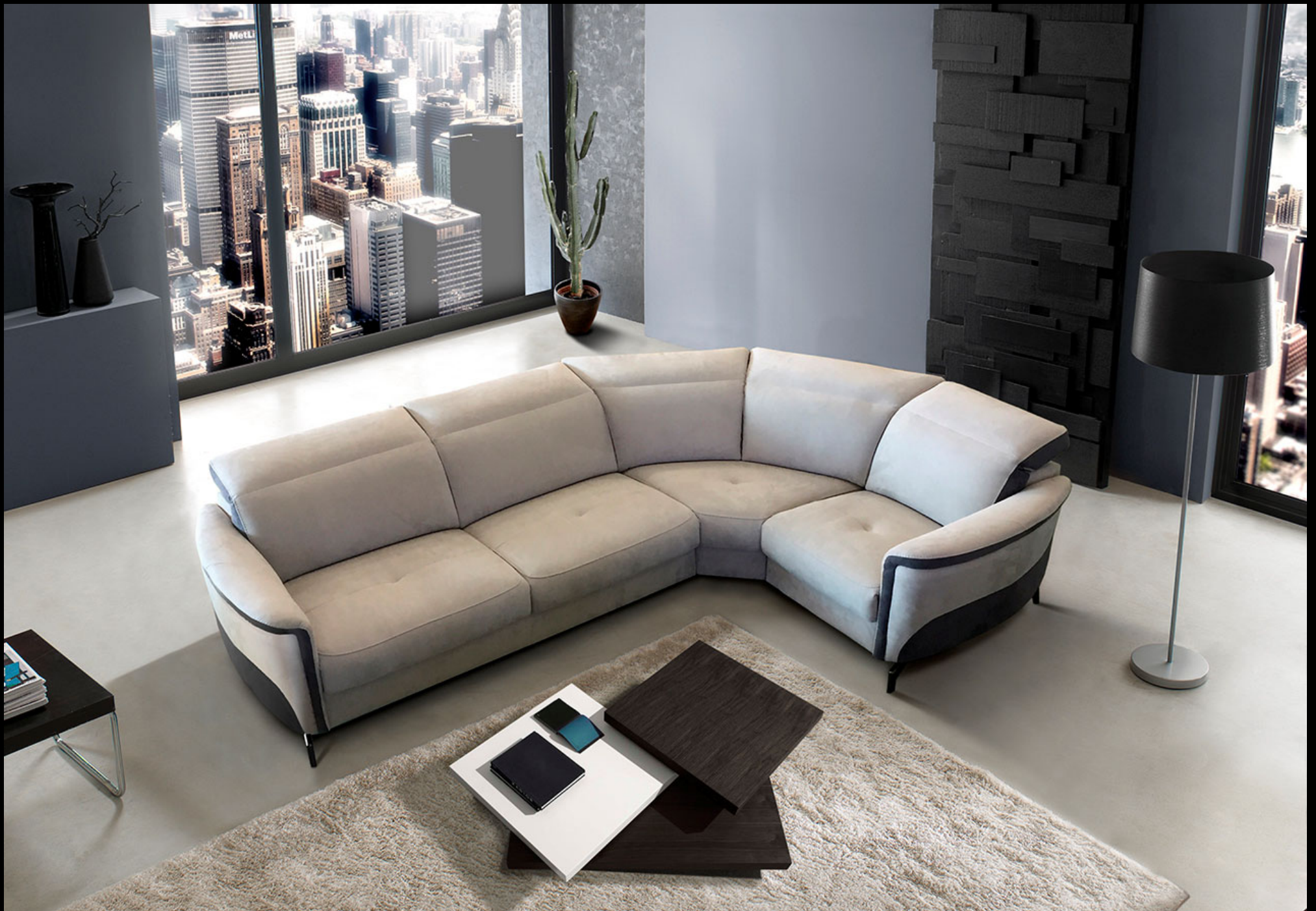
Meccano 3 Places Angle Ouvert 1 Place – Accoudoir A Dossier B Pied A