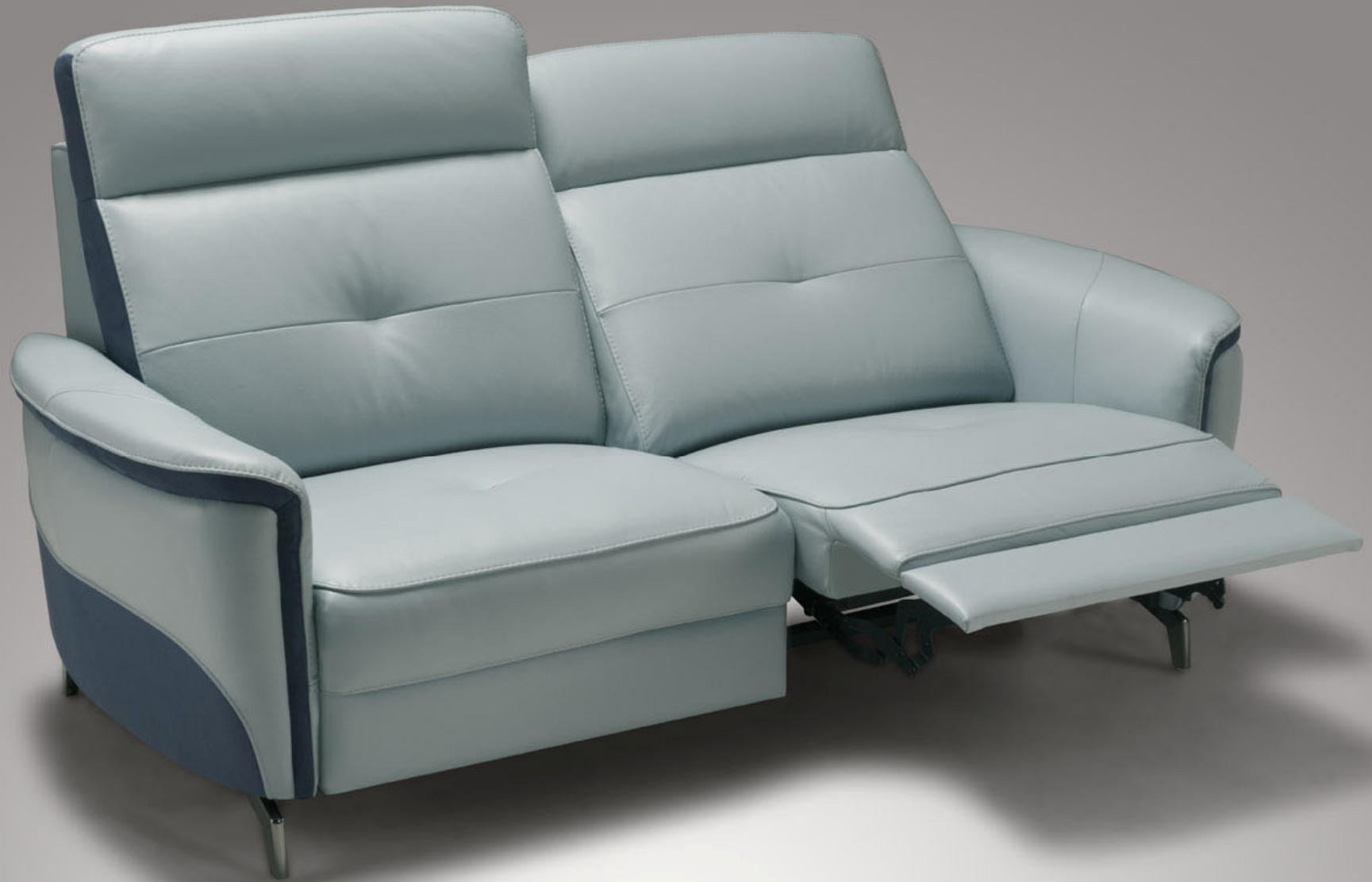
Meccano 3 places – Accoudoir A Dossier A Pied A