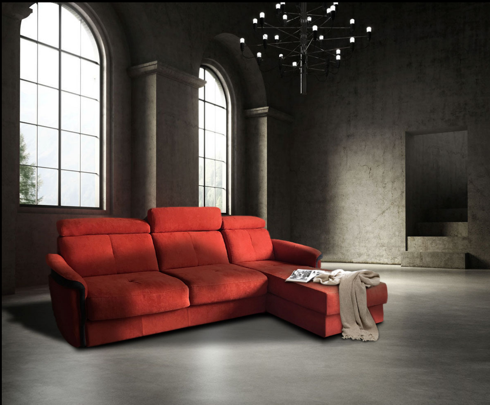
MODULO – Terminale 3 posti + Chaiselongue