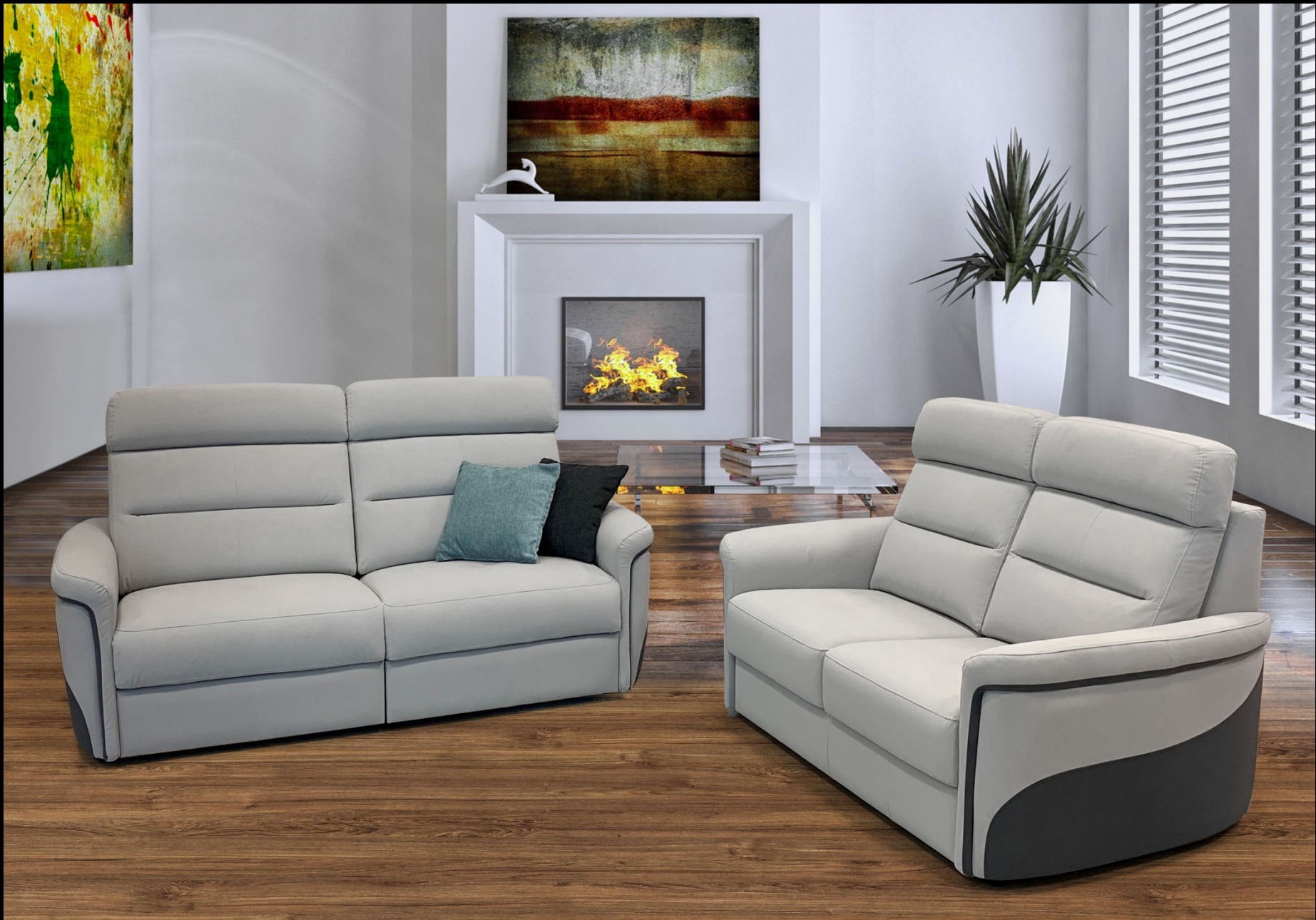
MODULO – 3 Posti + 2 Posti - Bracciolo 3 Spalliera A Tessuto Aqua Clean Carabu 76 dettagli in Carabu 110