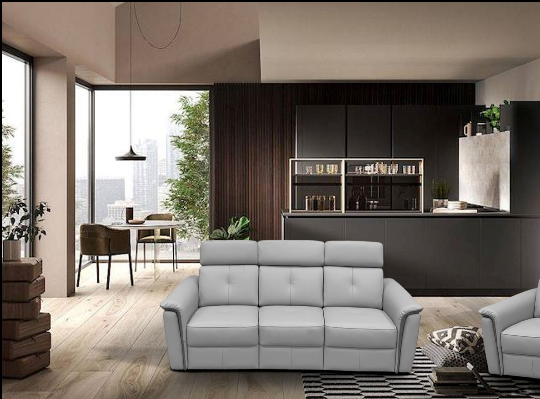
MODULO – Terminale 1 posto + Chauffeuse 58 cm + Terminale 1 posto