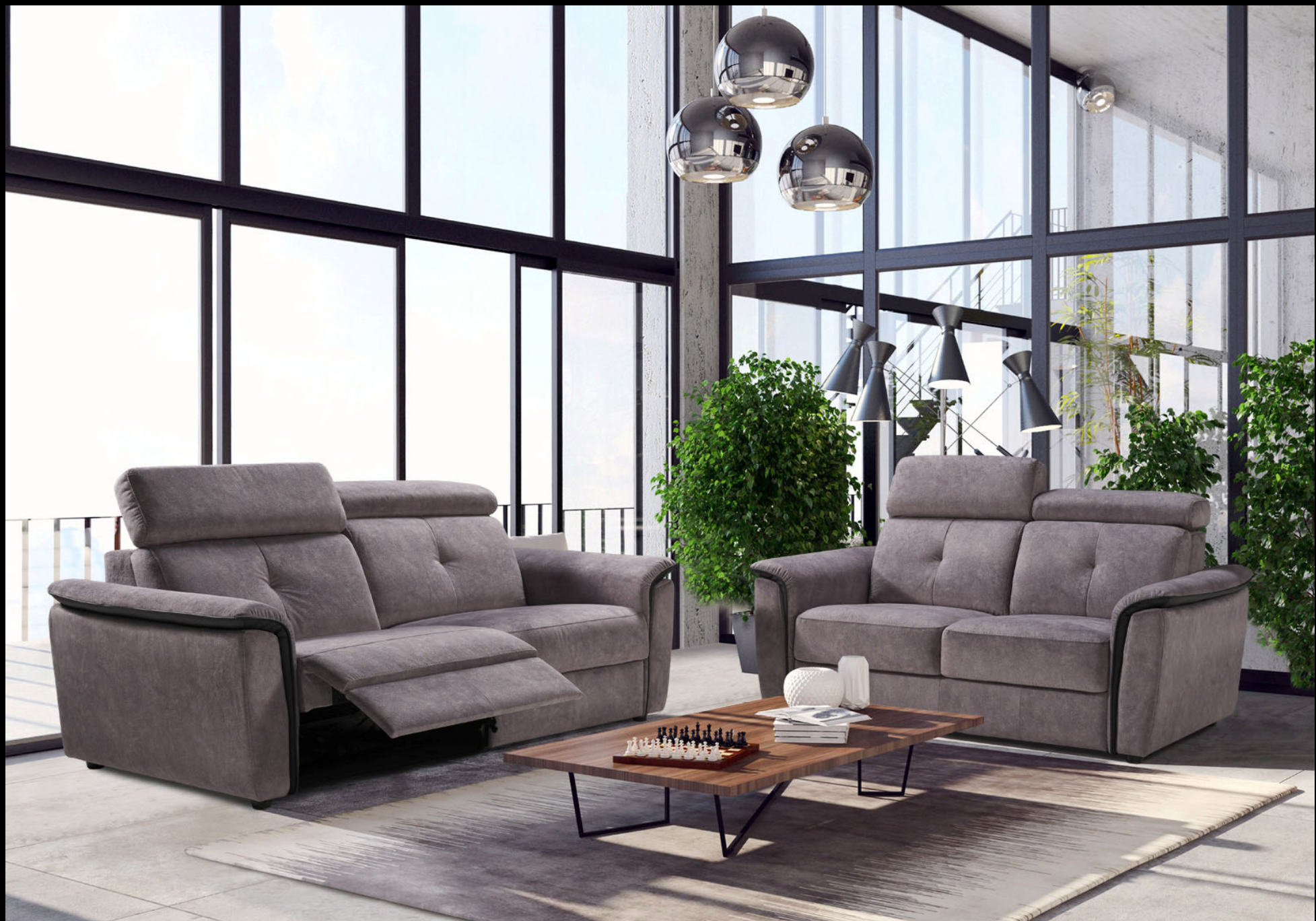
MODULO – 3 Posti + 2 Posti - Bracciolo B Spalliera B